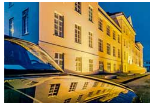
Landspítalinn Læknadeilan er enn í hnúti.

Læknar fara fram á háar launagreiðslur, miklu hærri en aðrir launþegar. Enginn efast um að læknar gegna mikilvægu starfi. Því gegna líka hinir sem voru hófsamir í kröfum sínum. Enginn er bættari með það ef verðbólga fer úr böndunum. Það hlýtur að vera áhyggjuefni hve mikið er um læknamistöð í heilbrigðiskerfinu. Eftir því sem sagt er fékk landlæknir 537 kvartanir frá 2011-2013. Þetta er óásættanlegt, einhverjir þurfa að sýna meiri ábyrgð í starfi.