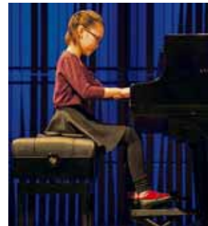
Tónlistarkennsla Margir skólur eiga í fjárhagsvanda.

Forsaga málsins snýr að samkomulagi ríkisstjórnarinnar og sveitarfélaganna frá árinu 2011 sem varðaði 250 m.kr. viðbótarfjárframlag ríkisins til eflingar tónlistarnáms, en framlagið var síðan aukið tímabundið árið 2012, í 290 m.kr. Samkomulagið leið