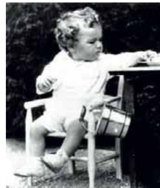
Charles litli Lindbergh skömmu áður en honum var rænt.

Angist greip um sig á heimili flugkappans Charles Lindberghs og eiginkonu hans, Anne, í East Amwell í New Jersey að kvöldi 1. mars 1932 þegar í ljós kom að frumburður þeirra, hinn tuttugu mánaða gamli Charles Augustus yngri, var horfinn úr vöggu sinni. Barnfóstran hafði lagt drenginn til hvílu um áttaleytið en þegar hún leit inn til hans tveimur klukkustundum síðar var hann horfinn.