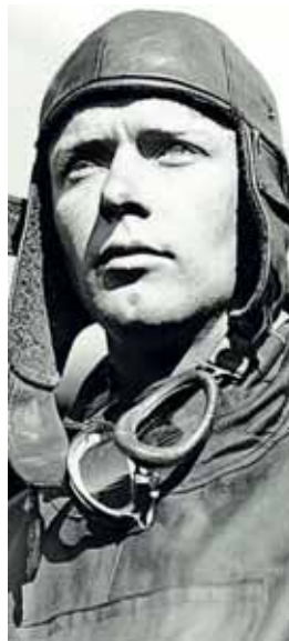
Faðir drengsins, Charles Lindbergh eldri.

Sjálfur Al Capone, sem var bak við lás og slá, bauðst til að láta finna barnið og skila því gegn lausn úr prisundinni. Sú aðstoð var afþökkuð