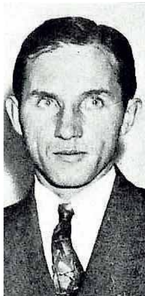
Bruno Richard Hauptmann var dæmdur til dauða.